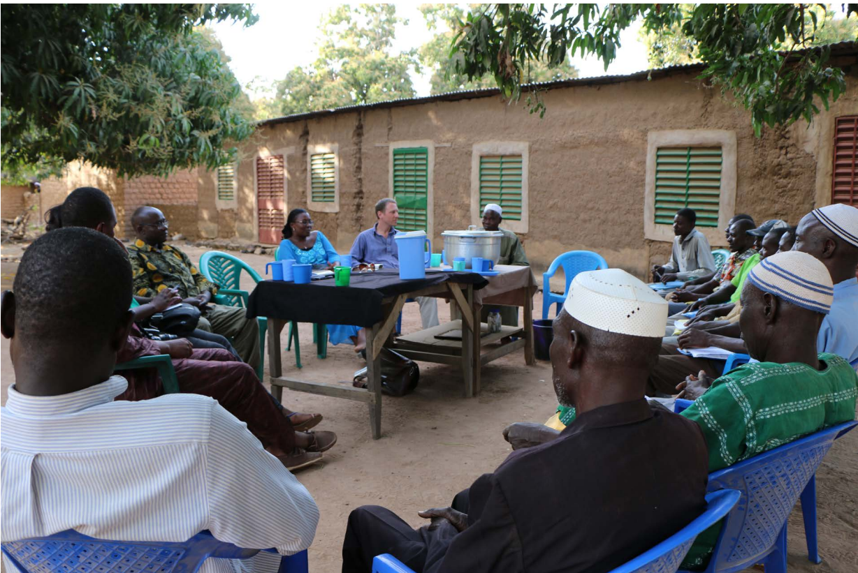
Rencontre entre producteurs-chercheurs

C'est pour combler ce manque fautif que la COPAGEN a suscité et accompagné une « recherche-action » paysanne sur l'impact du coton Bt au Burkina Faso. Elle s'est donnée pour objet de vérifier si les assertions qui ont justifié l'introduction de cette variété transgénique se confirment ou non sur le terrain et de contribuer ainsi au débat public sur cette culture controversée.