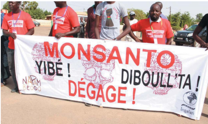
Manifestants lors de la Marche contre Monsanto, Ouagadougou, mai 2015

Les sociétés cotonnières au Burkina Faso ont également déposé une requête officielle auprès de Monsanto dans le but d'obtenir un dédommagement à hauteur de 50 milliards de francs CFA. Le géant des biotechnologies s'est mobilisé afin d'obtenir la plus grande discrétion sur ce contentieux susceptible d'abîmer son image et de décrédibiliser la grande propagande orchestrée autour des « bienfaits » des OGM.