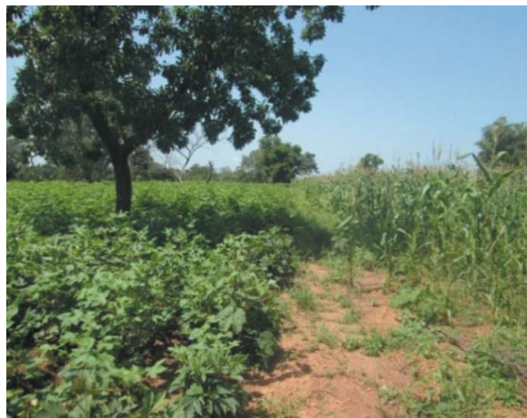
Cohabitation des champs de coton Bt et de maïs (1 m)