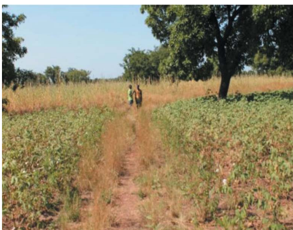
Distance entre un champ de coton Bt et un champ de coton conventionnel (2 m)

Les distances entre les champs de coton Bt et les autres cultures sont faiblement respectées. Certains producteurs de coton constatent l'infestation de leurs champs de sésame proche par des insectes (leurs chenilles) chassés par la toxine Bt. L'attaque des ravageurs commence aux abords du champ de coton avant de se généraliser sur toute l'étendue. On en déduit que le coton transgénique a un impact sur les autres cultures ainsi que les plantes environnantes. C'est d'autant plus préjudiciable que dans la plupart des cas, les parcelles voisines des champs de coton Bt sont variées, cultures vivrières et autres types de coton (biologique ou conventionnel).