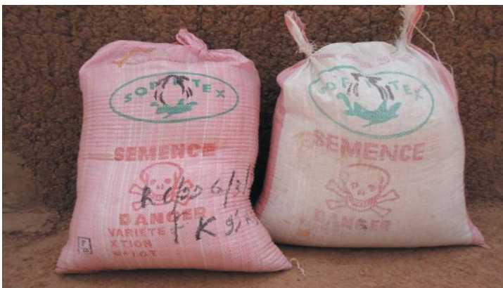
Sacs de graines de coton Bt.

En respect des normes nationales et internationales en matière de biosécurité, l'article 47 de la loi nationale stipule que « tout Organisme génétiquement modifié ou ses produits dérivés destinés à la diffusion intentionnelle ou à la commercialisation sur le territoire national doit être emballé et étiqueté de manière indélébile et infalsifiable afin d'assurer la sauvegarde des valeurs éthiques et culturelles, d'éviter les risques sur l'environnement, la santé humaine et animale. »