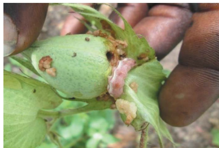
Une capsule de coton Bt attaquée par une chenille.

Toutefois, elle ne clôt pas le débat sur l'impact des OGM dans l'agriculture et l'alimentation. Ainsi, plusieurs producteurs témoignent que les tiges de coton Bt restées sur le champ après récolte ne sont que rarement attaquées par les termites, contrairement aux tiges de coton conventionnel, de sorgho, etc. Il est donc urgent de mener des recherches indépendantes sur la toxicité de ces végétaux transgéniques sur les sols, la santé humaine et animale (les graines de coton sont consommées dans de nombreux villages) ainsi que sur la contamination environnementale (cohabitation du Bt avec le coton conventionnel et le coton biologique), afin de mieux percevoir l'étendue des risques induits par la culture du coton Bt. Rappelons que dans de nombreux villages des zones cotonnières, les grains de coton sont autant consommés par les hommes que par les animaux.