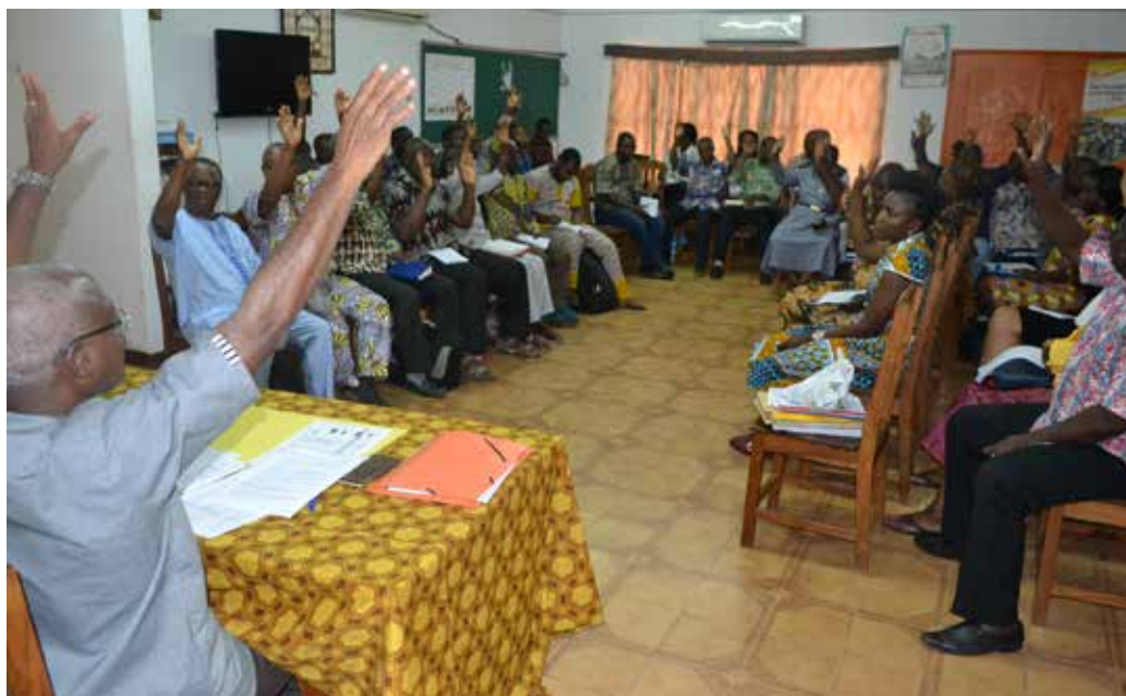
Photo de l'assemblée en plein vote à main levée

Les rideaux sont tombés sur la 19ème Assemblée Générale Ordinaire d'Inades-Formation Togo. Trente (30) associés ont honoré de leur présence cette rencontre annuelle qui a permis d'évaluer les activités du bureau national, tant sur le plan financier que technique.