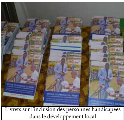
Livrets sur l'inclusion des personnes handicapées dans le développement local

Rien qu'à lire le titre de ce livret, les interrogations suscitent une curiosité et interpellent la conscience sur le sujet du handicap qui fait partie de la diversité humaine. L'inclusion des personnes handicapées aujourd'hui, est plus qu'indispensable; un oxygène pour le développement tout court. Elle renforce la cohésion sociale, valorise la dignité humaine, et répond aux objectifs de développement durable (ODD).