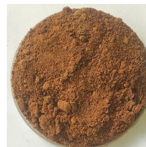
Bien moulin les graines jusqu'à l'obtention d'une poudre fine