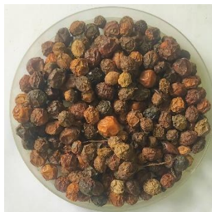
Graines de neem bien séchées