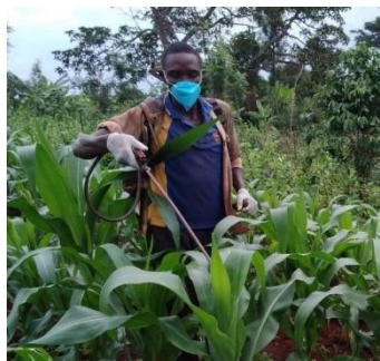
Pulvériser directement au niveau des feuilles encore enroulées.