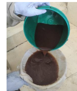
Filtrer la solution à travers un tamis fin ou tissu fin en nylon