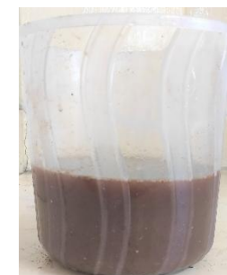
Solutionner et laisser reposer pendant 24 heures.